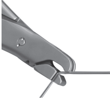
Pliage d'une broche de Kirschner Ø 1,5 mm